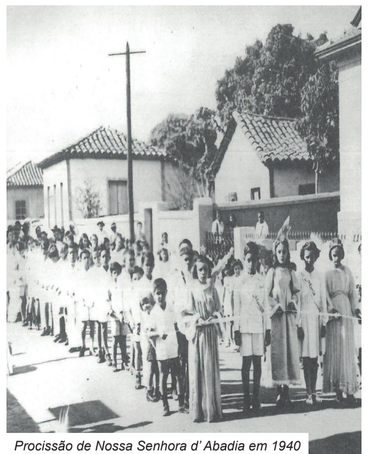
Procissão de Nossa Senhora d'Abadia em 1940