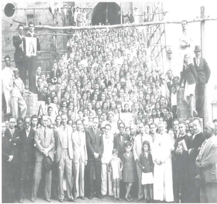
Romeiros de Araxá em frente a Igreja de Nossa Senhora d'Abadia em 1939

Proximidade geográfica, condições naturais e es-