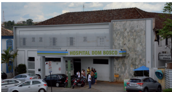
Hospital Dom Bosco