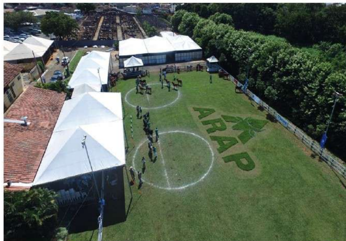
Área de julgamento

bares, restaurantes, tem baias para animais, área de julgamento de animais, sanitários, um tatarsal es-