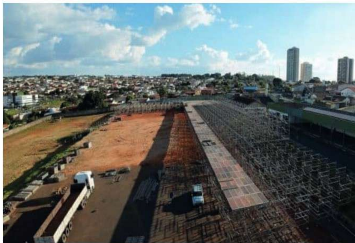
Parque de exposições Agenor Lemos

Localizado no bairro Santa Terezinha, o Parque de Exposições Agenor, foi criado na década de 50, na gestão do ex-prefeito Domingos Santos que fez a doação do terreno. A área que pertence à Arap- Associação dos Ruralistas do Alto Paranaíba, fica entre a rua Dr. Edmar Cunha e avenida prefeito Aracely de Paula. Um espaço centralizado que sempre foi palco de feiras agropecuárias e de grandes eventos e shows artísticos e culturais, com destaque para a tradicional Exposição Agropecuária de Araxá,