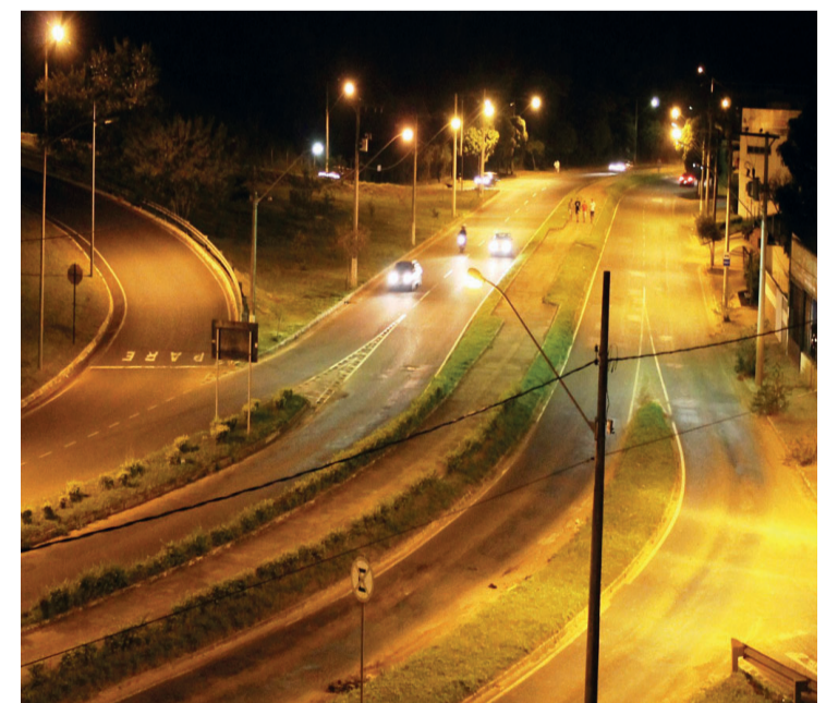
Av. Dâmaso Drummond