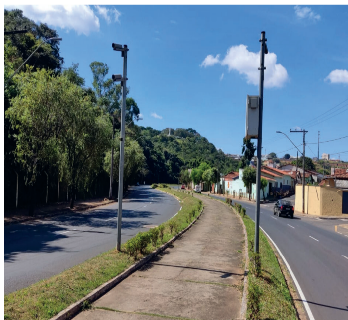
Av. Dâmaso Drummond

Ajude nos a contar nossas histórias. Se tiver uma foto, se souber de um caso, uma história que ache interessante ser contada, nos envie ou nos chame que iremos até você e publicaremos aqui