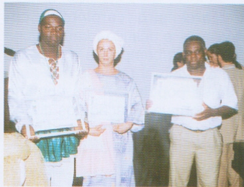
Os representantes da Associação de Congado e Moçambique, de Cultos Afro-brasileiros e Movimento Negro Sim recebem homenagem da Câmara Municipal de Araxá. 2001. (Acervo Conselho Comunidade Afro)