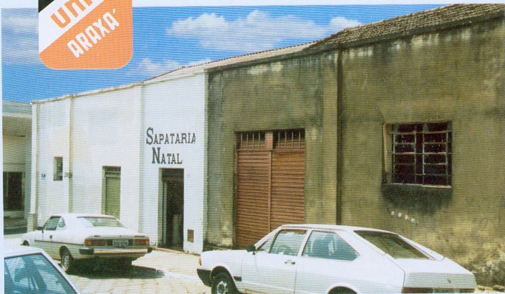
Lugar que abrigou a sede do Clube União. Rua Mariano de Ávila, década de 70.

P esquisar sobre o Clube União de Araxá e compartilhar essa história com nossos leitores é uma oportunidade preciosa. Sua fundação por um grupo de pessoas unidas por ideais comuns e seu papel exercido até os dias de hoje, quando completa 65 anos, é um manancial inesgotável de referências históricas. Sua existência envolve a formação de clubes, as atividades sociais e esportivas, o carnaval, a música, a dança, a política e, principalmente, a luta de uma comunidade em favor da cidadania e contra o preconceito racial.