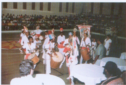
1º Encontro da Cultura Afro-brasileira. Apresentação de Congado. 1985

Nos últimos tempos, o avanço da atuação dos movimentos negros reacendeu o debate sobre a celebração de datas significativas para a cultura afro-brasileira.