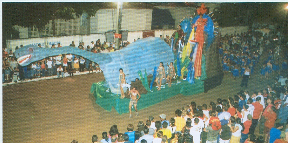
O ano de 2002 foi marcado pelo resgate do carnaval de rua em Araxá, 2002.