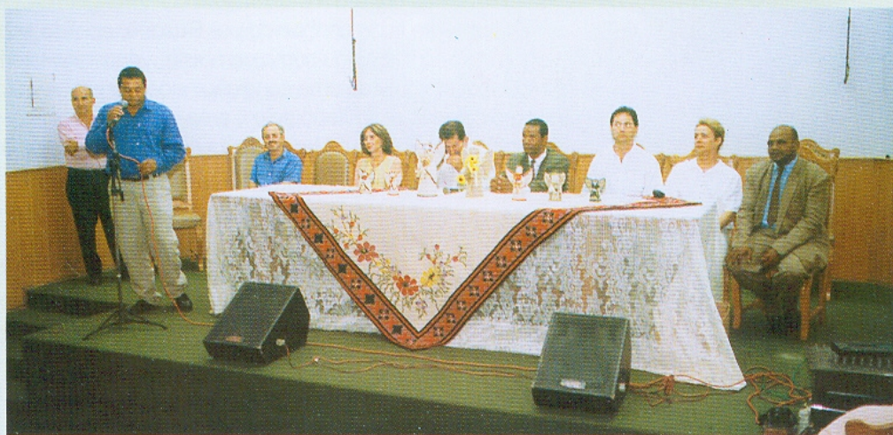
Entrega dos diplomas dos cursos promovidos pela CGTB, CNAB e Conselho da Comunidade Negra de Araxá, 2002.

Pesquisa e Texto: José Antônio de Ávila Oliveira.