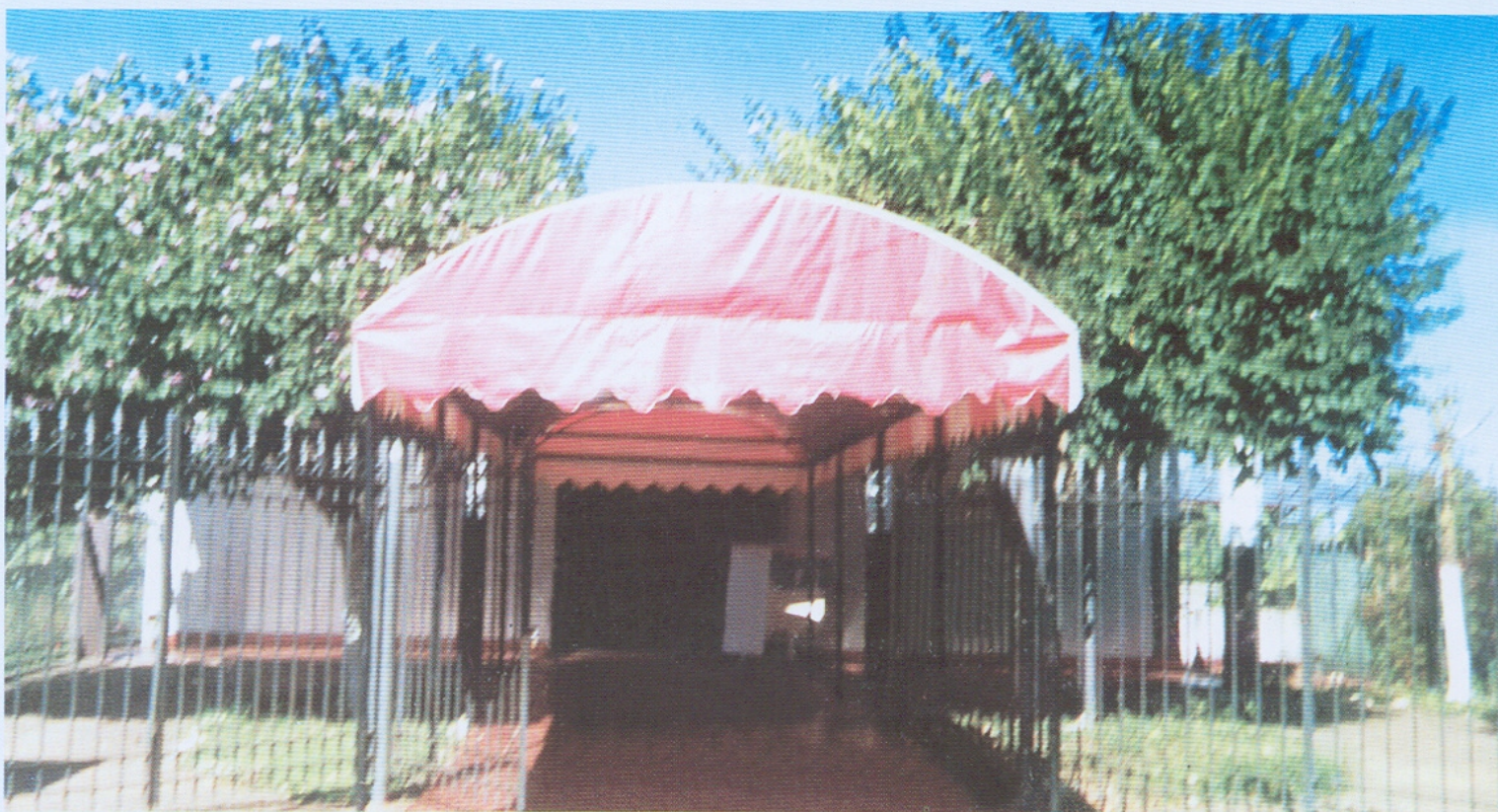
Fachada da sede do Clube União. Rua Santa Rita. Década de 80