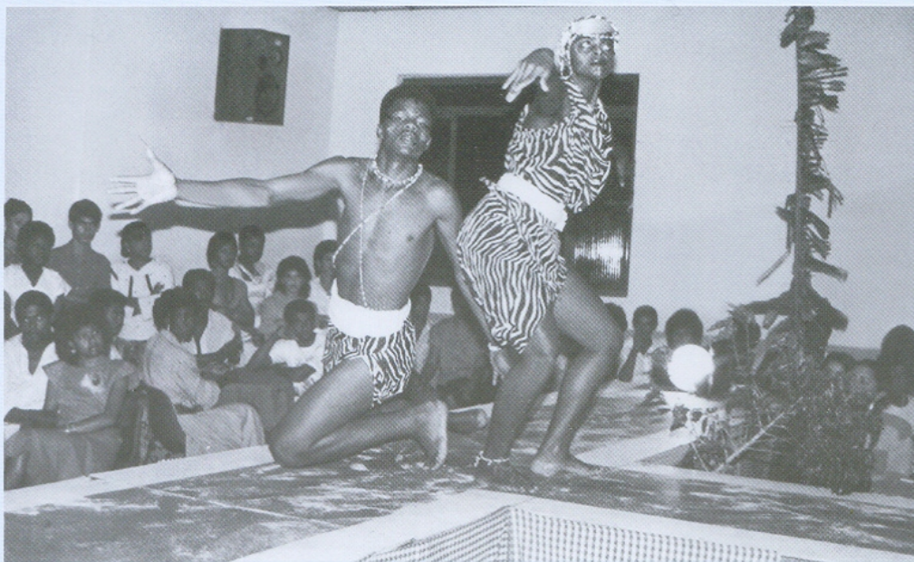
Apresentação de Dança Afro-brasileira. Comemoração dos 100 anos da Abolição. 1988