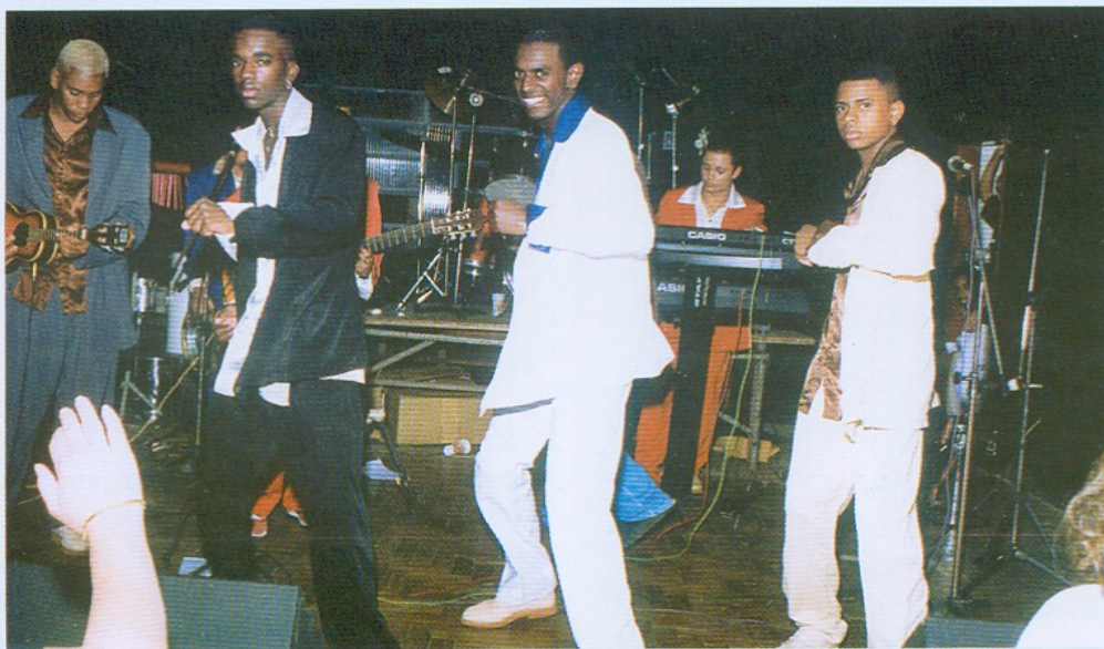
Grupo "Louco por Você" apresentando-se no Clube União. 2000.

única alternativa para quitar as dívidas — com o esforço para que o Clube União marcasse presença na comunidade. Tentando participar do Carnaval como sempre o fizeram em tempos passados, promovendo bailes de forró e de pagode, ou reativando o bar do clube, associados e diretores não desanimaram