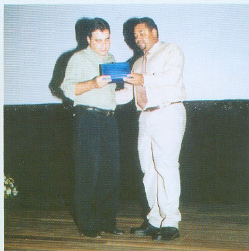
O prefeito Antônio Leonardo Lemos Oliveira, recebendo placa de honra ao mérito pelo apoio à comunidade negra, durante a festa da cultura Afro-brasileira realizada pela FCCB em parceria com o MinC e Fundação Palmares, 16/05/2001

As entidades que compõem o Conselho de Participação e Integração da Comunidade Afro-brasileira são: