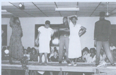
Desfile de Modas no Clube União. Comemoração dos 100 anos da Abolição. 1988

A adoção de uma série de mudanças administrativas tentava revitalizar o clube. O espaço físico passou a ser disponibilizado para aluguel aos não associados divulgando a inovação pela imprensa. Pela cidade circulou um "livro de ouro" com a finalidade de arrecadar fundos para a associação e consolidou-se o apoio institucional e financeiro da pre-