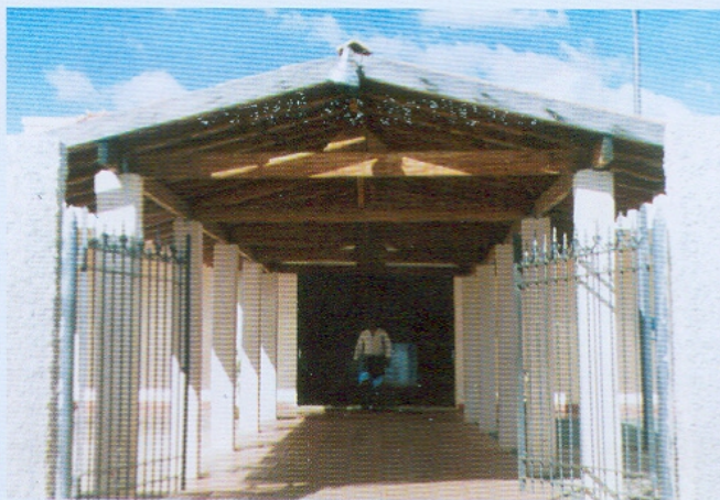
Entrada da sede do Clube União. Rua Santa Rita. Década de 90.

O período seguinte intercalou as iniciativas da venda do prédio — como