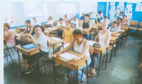
Alunos do curso de operadores de ecoturismo, promovido pela CGTB e Conselho da Comunidade Negra de Araxá. Escola Dona Gabriela, 2002.