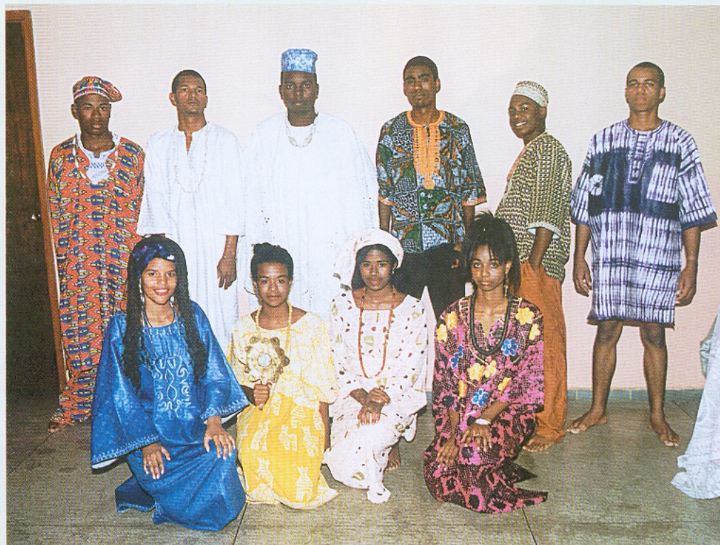
Festa da Cultura Afro-brasileira. Clube União. 2001.

Através do Conselho, realizou-se em Araxá, o Primeiro Encontro de Lideranças