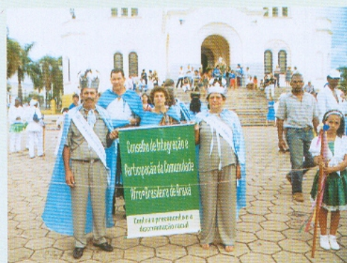
Conselho de Participação e Integração da Comunidade Negra de Araxá presente no Encontro Regional de Congado e Moçambique, 2001.

Entre os cursos que já foram realizados em parceria com a SETASCAD (Secretaria Estadual do Trabalho, Assistência Social, da Criança e do Adolescente), FAT (Fundo de Amparo ao Trabalhador), Prefeitura Municipal, Fundação Cultural Calmon Barreto e Secretaria de Turismo e Desenvolvimento Econômico, Congresso