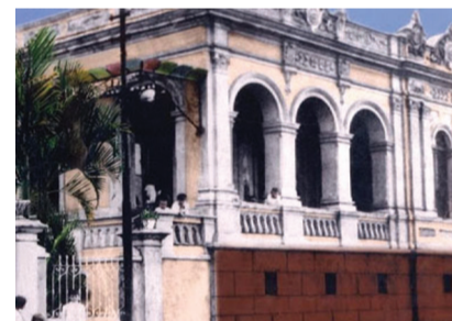
O antigo Casarão na rua Boa Vista