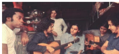
Clube da Esquina