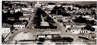
Panorâmica de Araxá em 1970

A nossa Araxá do ano de 1970 tinha de acordo com o censo oficial da época; 35.676 habitantes. Era até então um pobre município do interior de Minas Gerais, com a economia baseada no comércio e na atividade agropecuária. Na época ainda não existia regulamentação fiscal e nem taxação de impostos sobre a atividade mineral praticada no município.