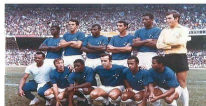
Time do Cruzeiro

O futebol mineiro na época estava em alta. Cruzeiro, Atlético e América desfilavam em campo um fino futebol com elencos recheados de craques como Tostão, Dirceu Lopes, Humberto Ramos, Jair Bala Piazza, Zé Carlos e Raul. Naquele ano o Atlético Mineiro foi o campeão estadual.