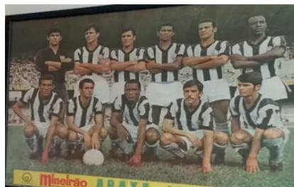
Araxá Esporte Clube

E após fazer um campeonato mineiro impecável em 1969, o Araxá Esporte Clube, participou da competição em 1970, num grupo regionalizado, onde 30 clubes jogaram o certame naquele ano. Na Chave A, além do Ganso, ainda tinham; Uberlândia, Uberaba, Nacional de Uberaba, Paraisense, Araguari e Caldense. Classificavam-se dois times de cada grupo. O Araxá ficou em quinto lugar. Naquele ano o campeão estadual de 70, foi o Atlético Mineiro.