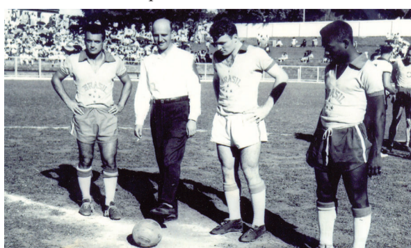
1958 - Chico Formiga, prefeito Domingos Santos e Pelé no Fausto Alvim