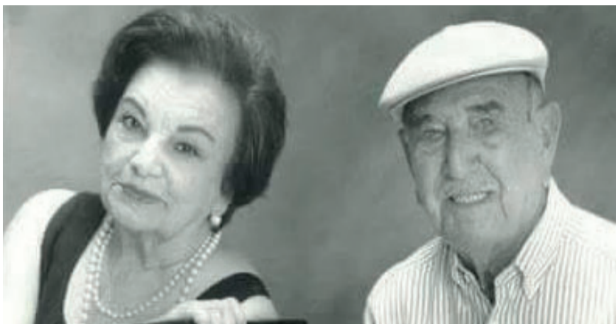
Domingos e a esposa