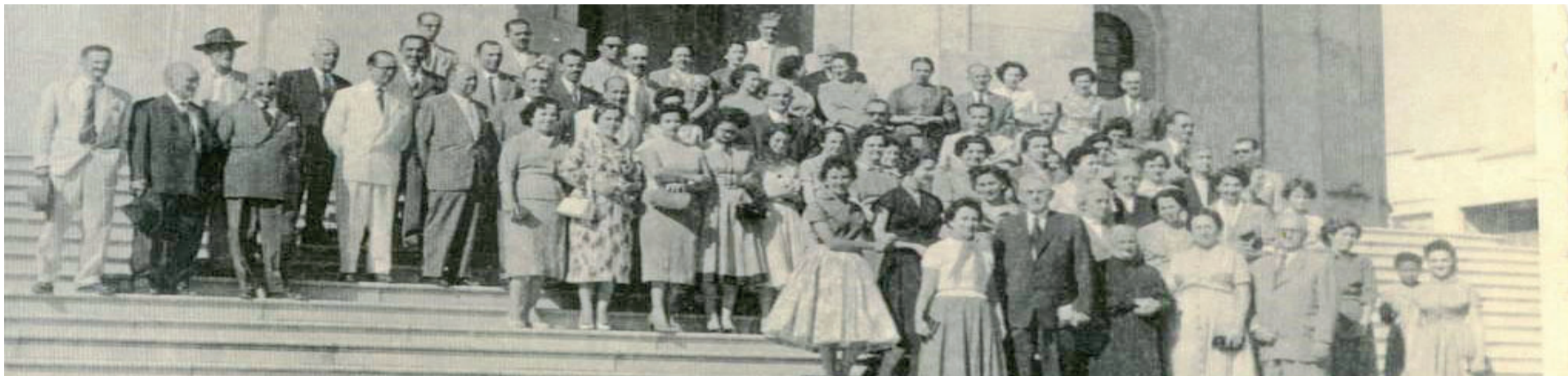
1º Encontro da Família Ferreira – Araxá 1955