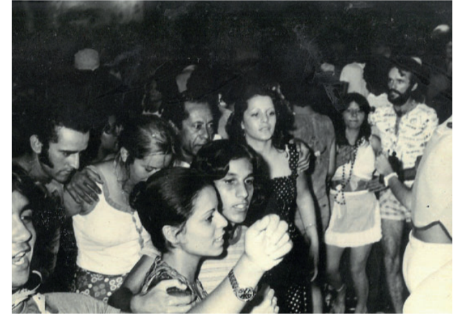
Década de 80 e o carnaval do Clube Araxá