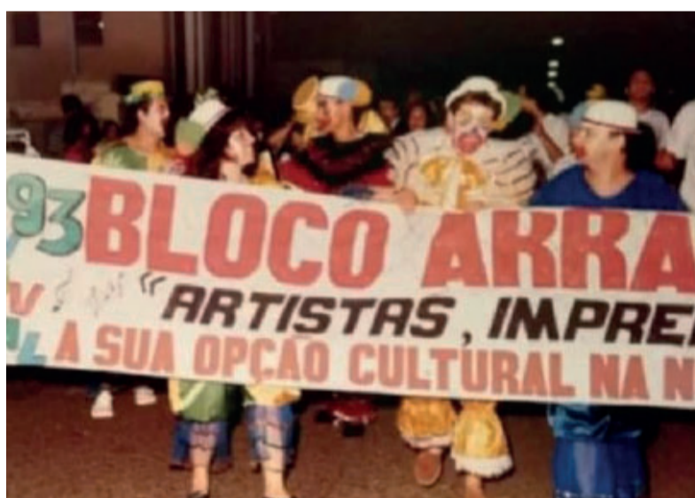
Década de 90 - o Bloco Arastão, composto pela imprensa e artistas