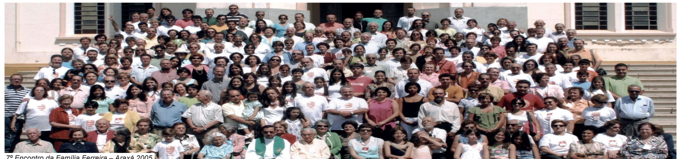
7º Encontro da Família Ferreira – Araxá 2005

esquecidas. Oxalá alguém das novas gerações se desperte para liderar a organização de novos encontros familiares, a fim de preservar a tradição e evitar que se perca no tempo.