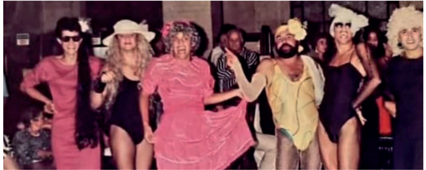
1988 - Grande Hotel e o Bloco dos Machões