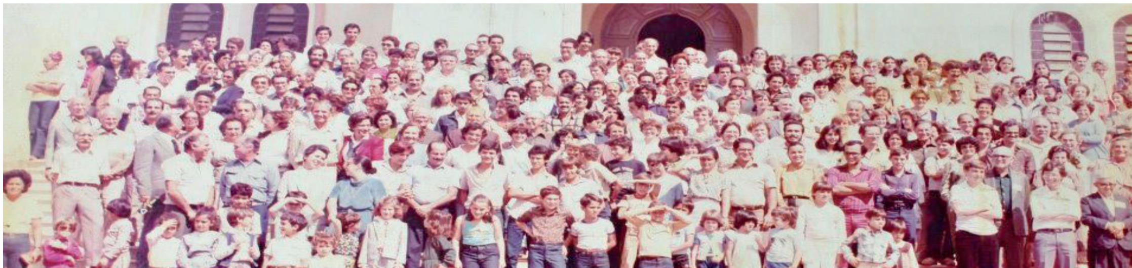
4º Encontro da Família Ferreira – Araxá 1981

contro aconteceu em 1968, também em Araxá, e o 4º em 1981, seguindo a mesma tradição, sempre celebrando a importância da convivência familiar.