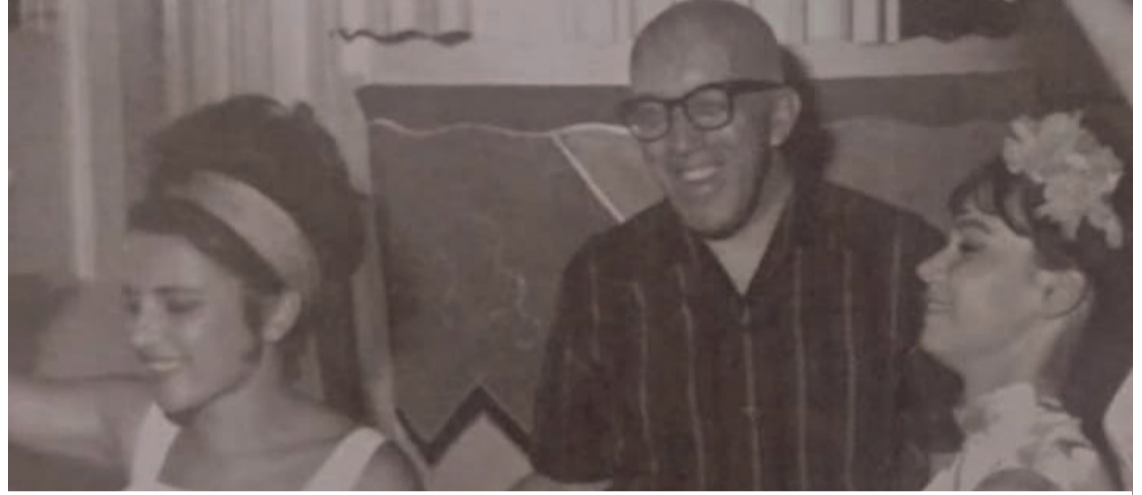
1964 - ex governador de MG Magalhães Pinto no carnaval do Grande Hotel