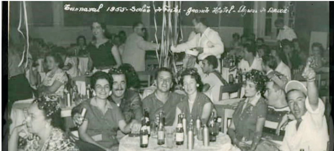
1955 - Salão do Grande Hotel e os foliões nas mesas

Nesta edição, o “Memórias e Histórias de Araxá e Região”, entra na alegria do samba e resgata através de fotos antigas, um pouco dos len-dários e inesquecíveis carnavais de todos os tempos de Araxá e seus personagens em momentos de festa, folia e descontração. Confira a nossa galeria que está recheada de muita alegria, confete e serpentina: