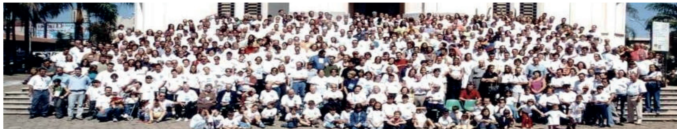
6º Encontro da Família Ferreira – Araxá 2002

todos. Assim, em 2002, o 6º Encontro da Família Ferreira foi celebrado em grande estilo em Araxá, reunindo mais de 1200 participantes.