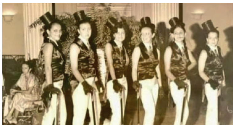
1997 - Grande Hotel - e o Bloco das Amigas