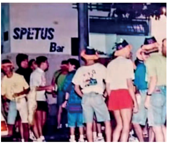
1993 - Carnaval na porta do Spetus Bar