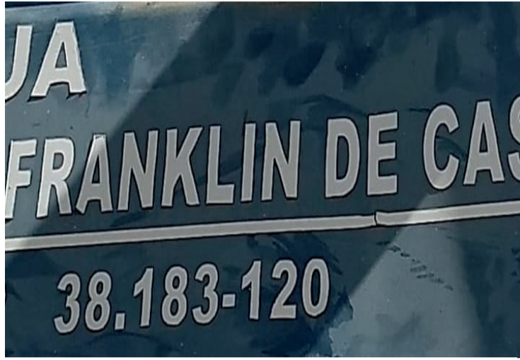
Placa da rua Franklin de Castro no centro de Araxá

A centralização do poder nas mãos do agente munic