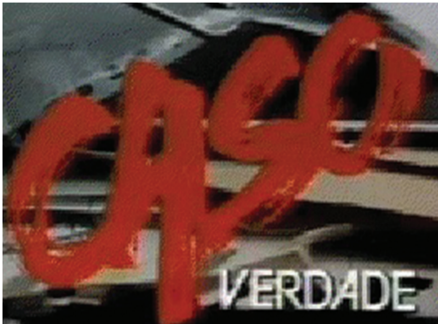
Marca do programa da Rede Globo