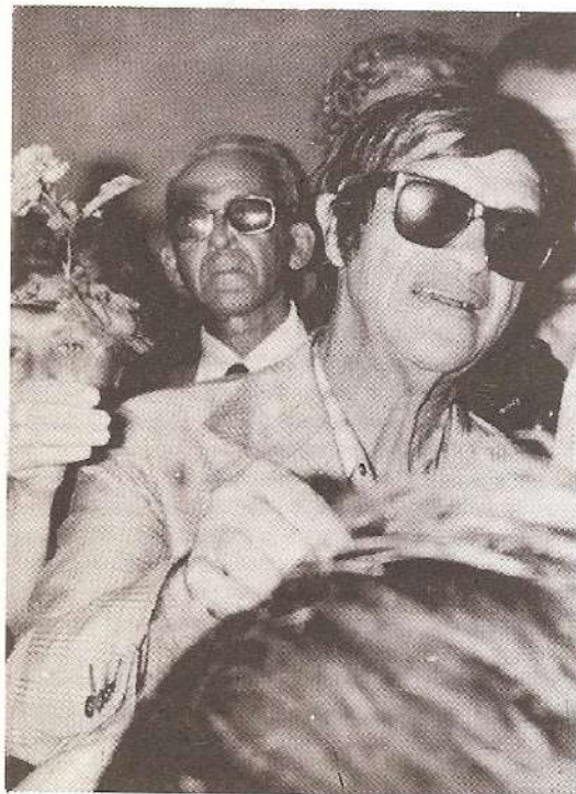
Momento em que Chico Xavier distribuiu rosas à população de Araxá.