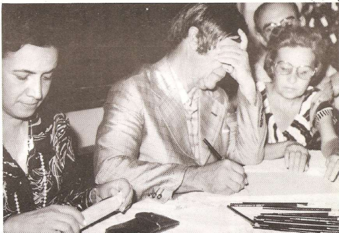
Chico Xavier recebeu do espírito de Maria Dolores o poema Caminho do Bem.