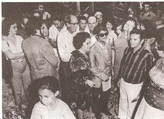
Visita à Araxá em 1976

Outrora, convertíamos a existência corpórea em instrumento de preservação da animalidade e do crime, depedrando as promessas da luz, cristalizados que nos achávamos na fuma de nossa própria miséria!